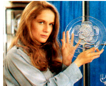
1978 UTOPIA (Utopia) d'Iradj Azimi