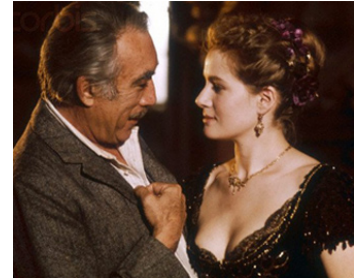
1976 L'HÉRITAGE (L'Eredità Ferramonti) de Mauro Bolognini avec Anthony Quinn