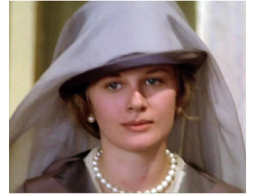
1974 VIOLENCE ET PASSION (Gruppo di famiglia in un interno) de Luchino Visconti