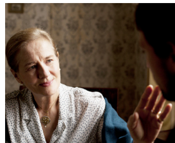
2014 UN BEAU DIMANCHE de Nicole Garcia avec Pierre Rochefort