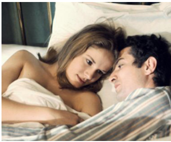
1969 UNE FEMME DOUCE de Robert Bresson avec Guy Frangin