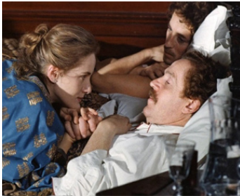
1977 AU-DELÀ DU BIEN ET DU MAL de Liliana Cavani avec E. Josephson, Robert Powell