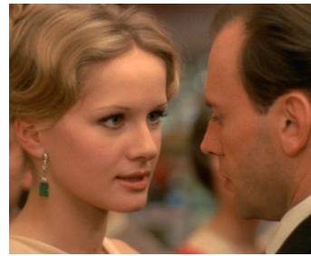
1970 LE CONFORMISTE (Il conformista) de Bernardo Bertolucci avec J-L. Trintignant