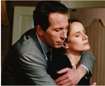
1988 IL DECIMO CLANDESTINO de Lina Wertmüller avec Hartmut Becker