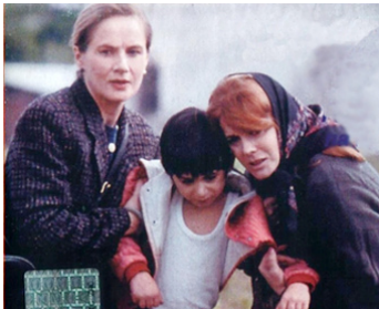
1993 LES ENFANTS DE LA HONTE (Nobody's Children) de David Wheatley avec Ann-Margret