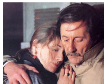
1982 L'INDISCRÉTION de Pierre Lary avec Jean Rochefort