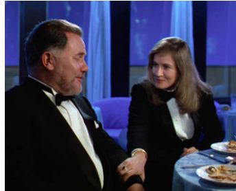
1990 EMBARQUEMENT POUR L'ENFER (L'Achille Lauro) d'A. Negrin avec B. Fresson