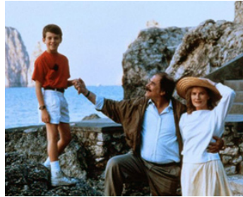
1989 IL FAUT SAUVER BOBBY (Voglia di vivere) de Ludovico Gasparini avec Tomas Milian