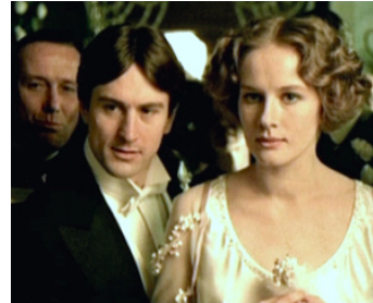
1976 1900 (Novecento) de Bernardo Bertolucci avec Robert De Niro