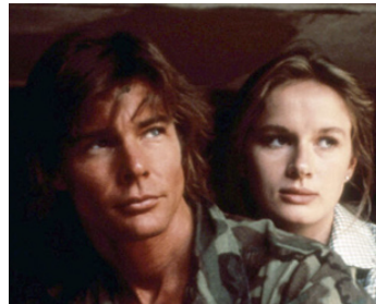
1977 LES SURVIVANTS DE LA FIN DU MONDE (Damnation Alley) de J. Smight avec J. M. Vincent