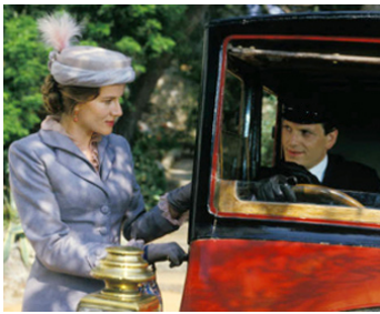
1984 LE MATELOT 512 de René Allio avec Tchêky Karyo