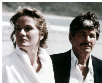
1980 CABO BLANCO de Jack Lee-Thompson avec Charles Bronson