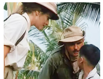
1983 POUSSIÈRE D'EMPIRE de Lam Lê avec Jean-François Stévenin