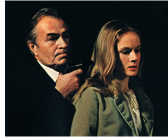
1973 LE PIÈGE (The Mackintosh Man) de John Huston avec James Mason