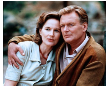
1994 BRENNENDES HERZ de Peter Patzak avec Helmut Griem