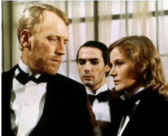
1974 LE LOUP DES STEPPES (Der Steppenwolf) de Fred Haines avec M. von Sydow, P. Clémenti