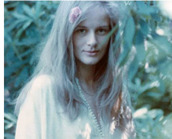
1976 LE BERCEAU DE CRISTAL de Philippe Garrel