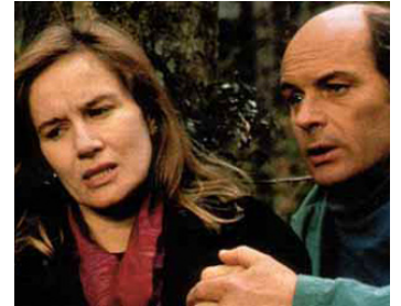
1991 ILS N'AVAIENT PAS RENDEZ-VOUS de Maurice Dugowson avec J-F. Stévenin