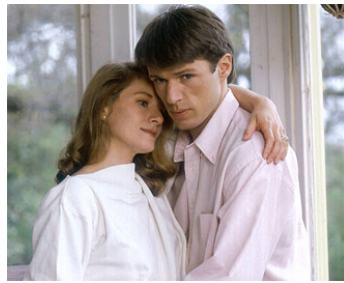
1986 CORPS ET BIENS de Benoît Jacquot avec Lambert Wilson