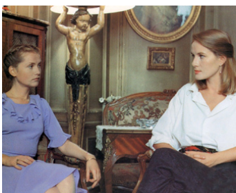
1981 LES AILES DE LA COLOMBE de Benoît Jacquot avec Isabelle Huppert