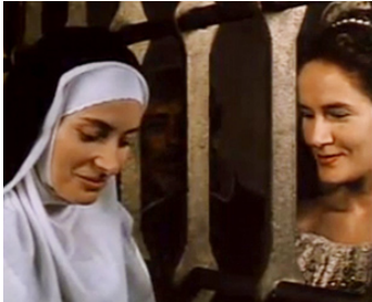
1990 MOI, LA PIRE DE TOUTES (Yo, la peor de todas) de Maria-Luisa Bemberg avec A. Serna