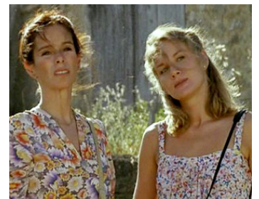
1980 LE VOYAGE EN DOUCE de Michel Deville avec Géraldine Chaplin