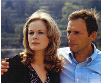
1971 SANS MOBILE APPARENT de Philippe Labro avec Jean-Louis Trintignant