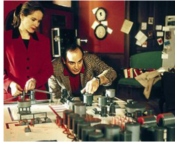
1992 DER FALL LUCONA de Jack Gold avec David Suchet