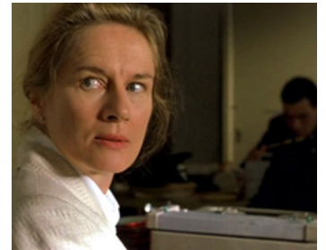
1999 GARAGE OLIMPO (Garage Olimpo) de Marco Bechis