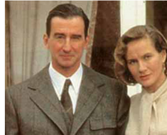
1990 WARBURG, LE BANQUIER DES PRINCES (Warburg) de M. Mizrahi avec Sam Waterston