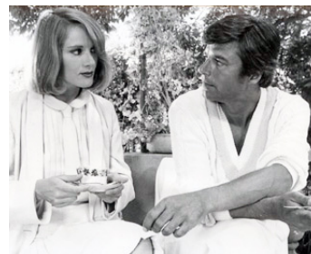
1980 LA NAISSANCE DU JOUR de Jacques Demy avec Jean Sorel