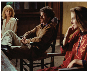
1978 LE NAVIRE NIGHT de Marguerite Duras avec Bulle Ogier, Mathieu Carrière