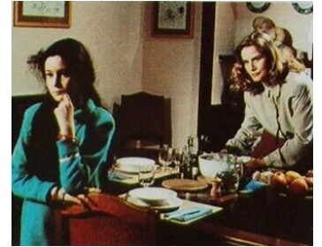
1990 VALSE D'AMOUR (Tolgo il disturbo) de Dino Risi avec Eva Grimaldi