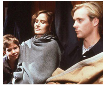
1987 UN TRAIN POUR PETROGRAD (Il treno di Lenin) de D. Damiani avec Jason Connery