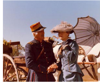
1990 GUERRIERS ET CAPTIVES d'Edgardo Cozarinsky avec Federico Lippi